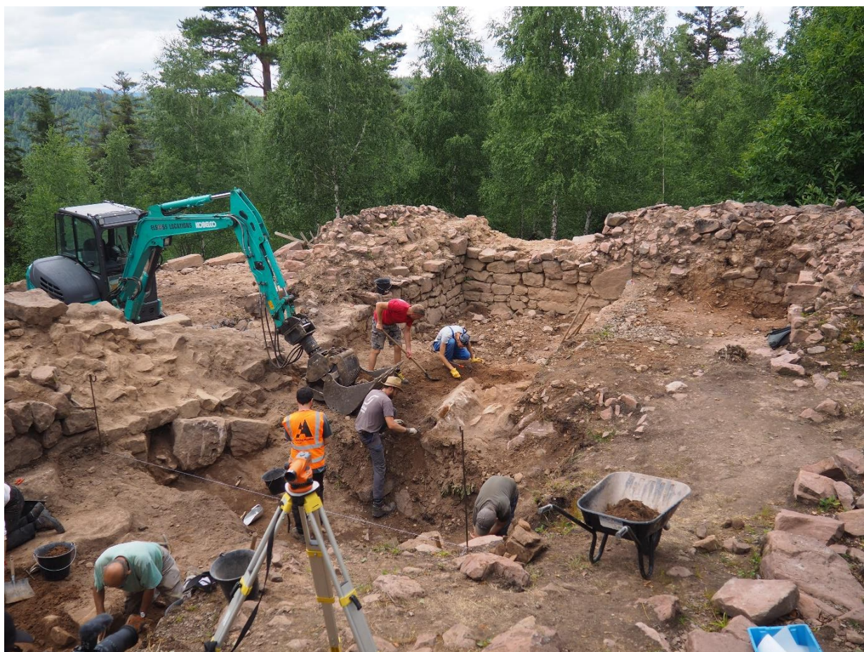
Bénévoles et chercheurs au travail

Sous la direction de F. Minot (Archéologie Alsace) et T. Martine (Université de Lille), une fouille archéologique se déroule depuis l'été 2022. Cette opération, née d'un partenariat entre les chercheurs et le Club Vosgien Purpurkopf, est soutenue par la ville de Rosheim, Archéologie Alsace et la Direction Régionale des Affaires Culturelles. Elle s'appuie également sur un réseau de laboratoires de recherche, d'associations et d'entreprises locales, qui participent à son financement. Les fouilles continueront en 2024 et 2025 en s'appuyant sur une équipe composée d'une vingtaine d'étudiants et de bénévoles.