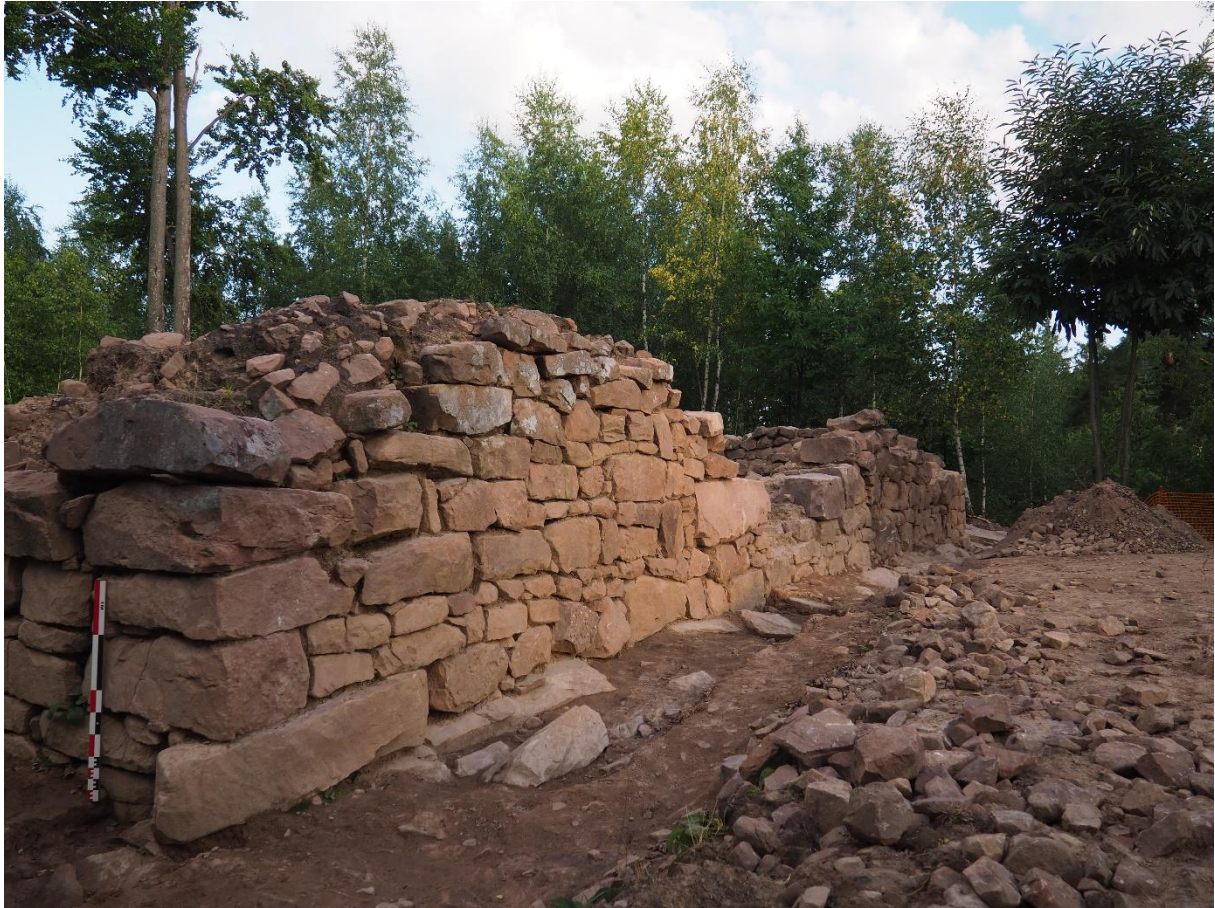
Le grand bâtiment du Purpurkopf