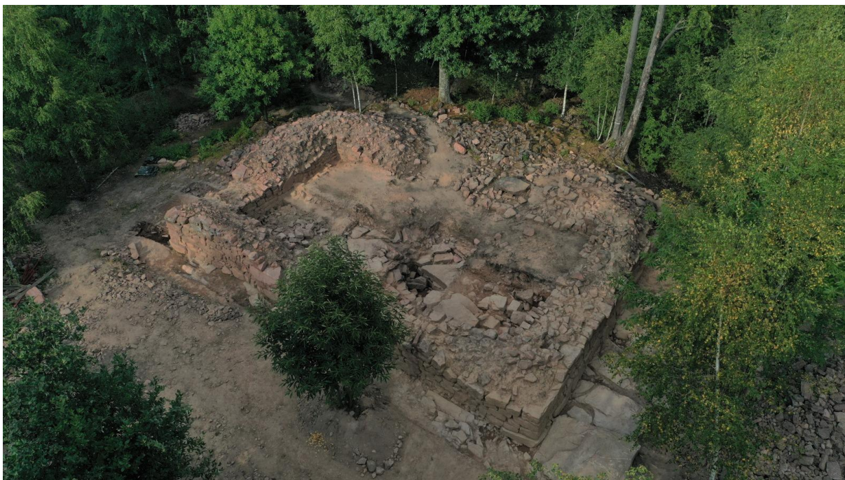
Vue aérienne du château