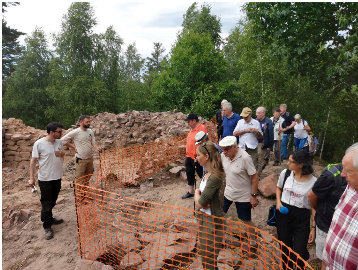
Portes ouvertes sur le chantier le 15 juillet 2023