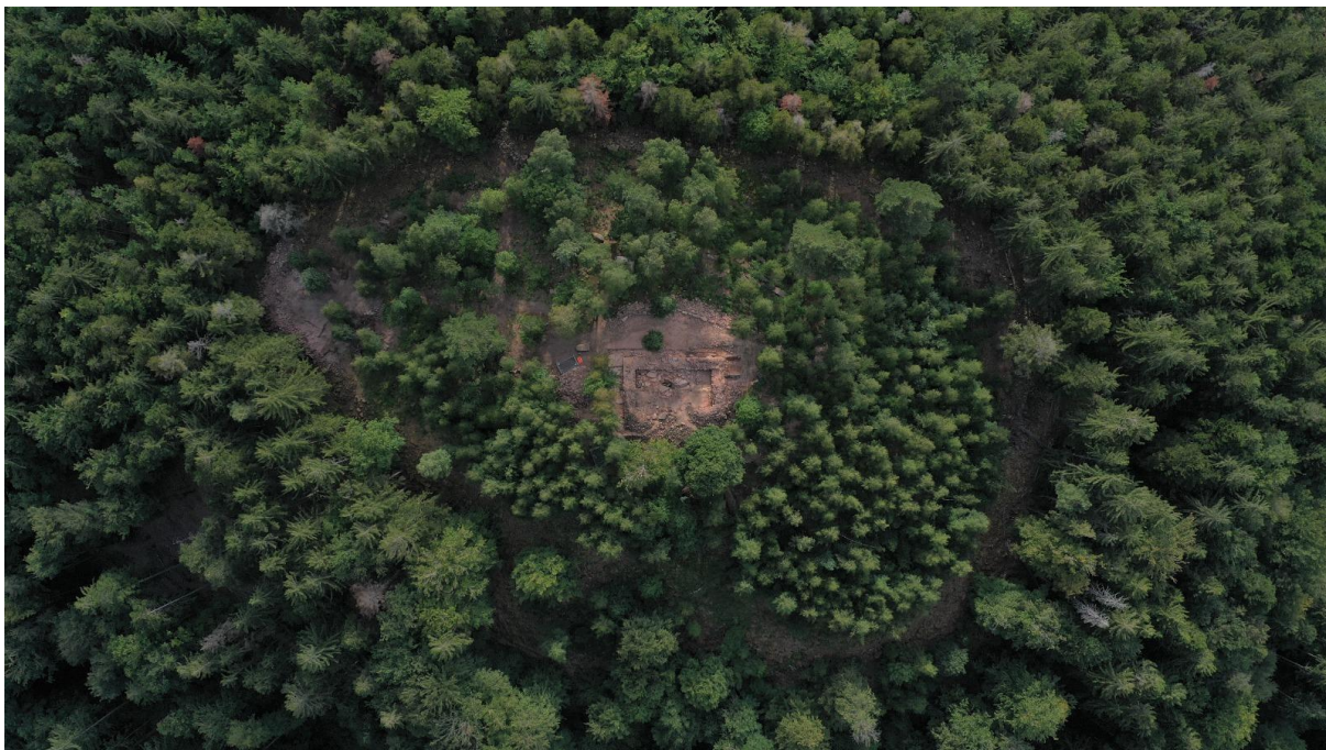
Vue aérienne de l'ensemble du site