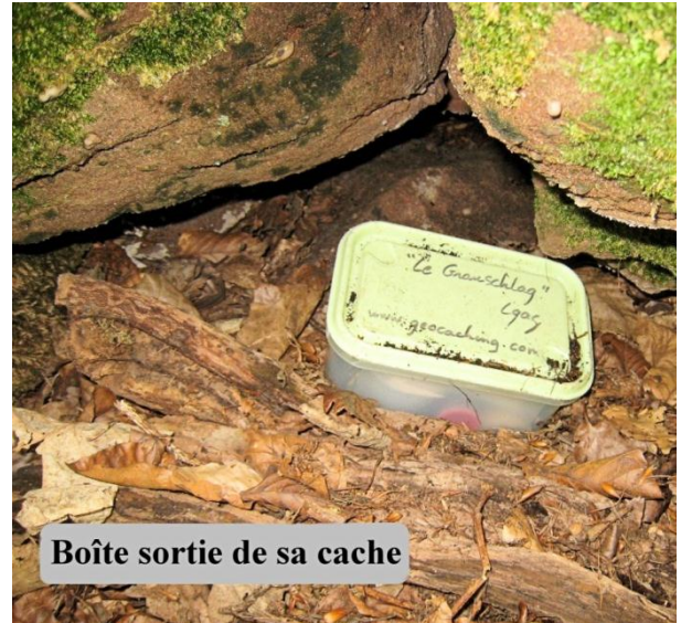
Boîte sortie de sa cache

Sur le site internet chaque cache est décrite et des renseignements sont fournis, sur le lavoir du village, la ruine des Vosges, le monument de la ville... Vous pouvez même programmer vos sorties ou voyages en fonction des caches du parcours.