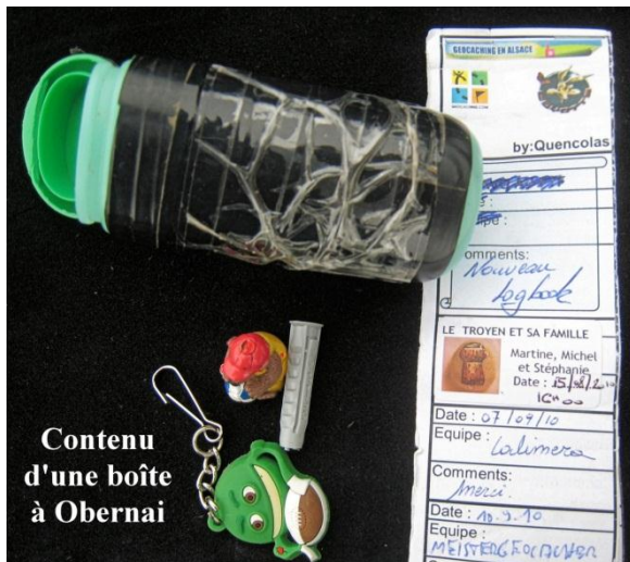
Contenu d'une boîte à Obernai

Certains géocacheurs alsaciens ont à leur palmarès des géocaches en Andorre, en Russie et jusqu'en Chine!