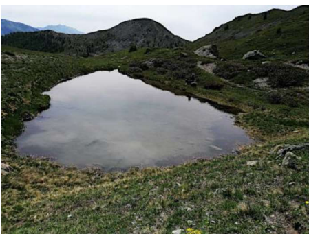
Lac proche du col du Granon 2413 m

« J'ai passé une semaine dans ce club en juin 2023 pour y préparer ce séjour, prendre des attaches, expérimenter des randos, connaître son fonctionnement, discuter avec le responsable des guides. Le centre coche toutes les cases pour un séjour de randonnées réussi ! »