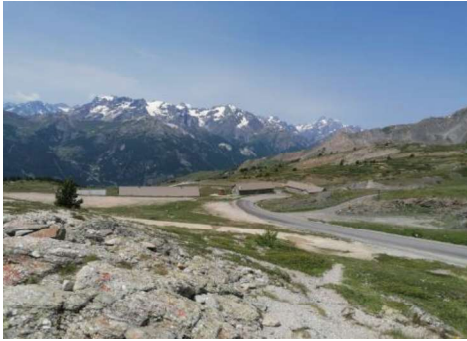
Les Ecrins depuis le col du Granon

Une semaine de séjour au « Club les Alpes d'Azur » géré par Vacances Bleues, situé à Chantemerle, entre le col du Lautaret et Briançon, avec randonnées pédestres à la journée.