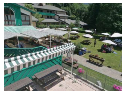
Une partie du bâtiment et du parc

Informations sur l'hébergement et le « Club Les Alpes d'Azur » sur le site